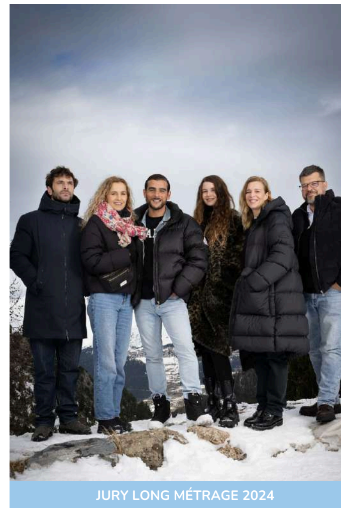
JURY LONG MÉTRAGE 2024