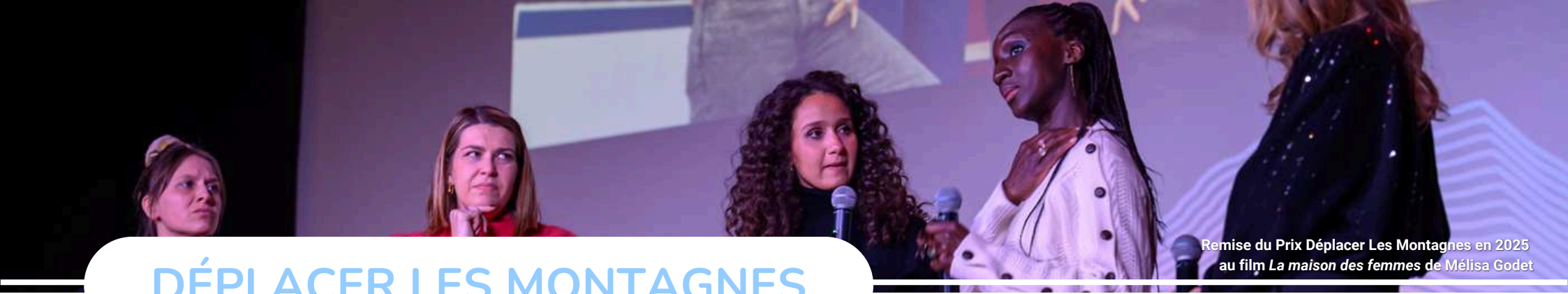
Remise du Prix Déplacer Les Montagnes en 2025 au film La maison des femmes de Mélisa Godet