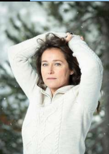
SIDSE BABETT KNUDSEN